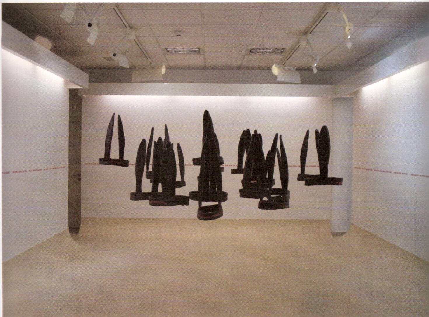
Ana Pérez Quiroga, "Antes morta que burra", 2005. Instalação. 19 orelhas, feltro, bordado c/ linha algodão, pvc, fio de nylon. Dimensões variáveis, cada orelha, 50 x 35 cm

O que é interessante é que tenho que tropeçar nos objectos. Ainda assim, esses objectos que guardo são uma selecção de uma panóplia de objectos que tenho à disposição. Não me interessam todos, existindo uns que selecciono a título de souvenirs , de apontamentos. É um trabalho que está muito relacionado com a memória e com a lembrança, sobretudo no seu sentido de oferenda. É um eleição que se situa no plano estético-afectivo.