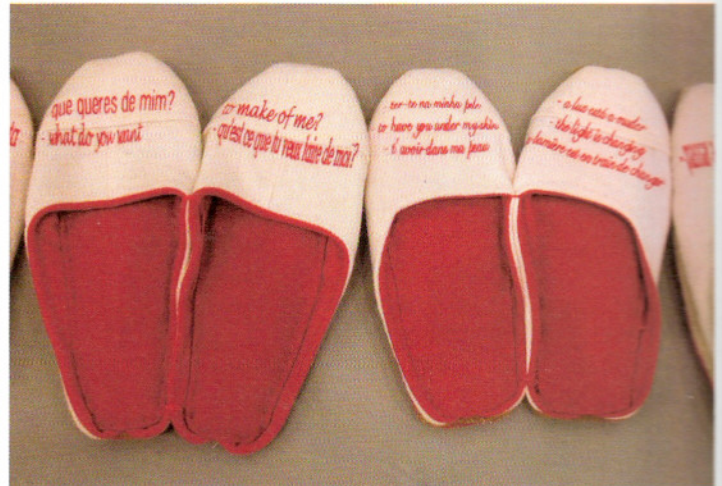
Ana Pérez-Quiroga, “para que me calientes por la noche”, 2002. Instalação. 80 pares de chinelos em tecido de lã, cosidos à mão (exterior branco/ interior vermelho) com texto bordado à vermelho (cada par de chinelos contém um texto diferente), dimensões variáveis. cada par de chinelos, 28 x 21 cm

sentido valorizo muito os catálogos, porque dão uma noção da estrutura e do pensamento que lhes atribuo. Essa série de objectos encontrados tem uma coerência plástica, e quando digo plástica, digo muito escultórica. Um objecto é sempre tridimensional, não tem duas dimensões, pois não estamos a falar de uma folha de papel, mas estes objectos passaram a estar emoldurados e assim situam-se quase ao nível da bidimensionalidade. Gosto muito das fronteiras que são muito ténues, e é nelas que gosto de trabalhar. Podemos voltar outra vez ao quotidiano, é nele que nós vivemos e quando eu o alargo para outras fronteiras são fronteiras de caminho. Mas para onde é que nós caminhamos? Sempre para um outro espaço, são sempre espaços. Não é só a moldura que é uma redoma, o espaço também o é. Por sua vez, o espaço também está dentro de uma outra redoma. O nosso mundo contemporâneo também é uma bolha que está dentro de um mundo maior que, na verdade, não tem nada de contemporâneo. São pequenos redutos e interessa-me particularizá-los. Talvez por isso tenho tanta necessidade de datar os objectos. As legendas, esta precisão cronológica também tem a ver com essa mesma vivência dos mundos. De pôr mundo, de conferir qualquer coisa de importante, de permanência ao que nos rodeia. ■