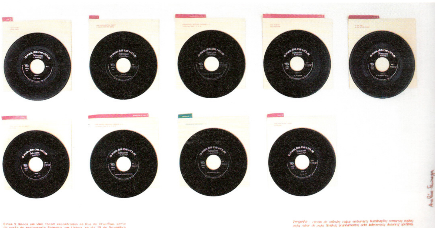
Estes 9 discos em vinil, foram encontrados na Rua de Cruzifixo, perto da porta do restaurante Palmeira, em Lisboa, no dia 28 de Novembro